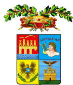
Provincia Regionale di Trapani