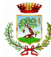
Comune di Buseto Palizzolo