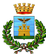
Comune di Calatafimi Segesta